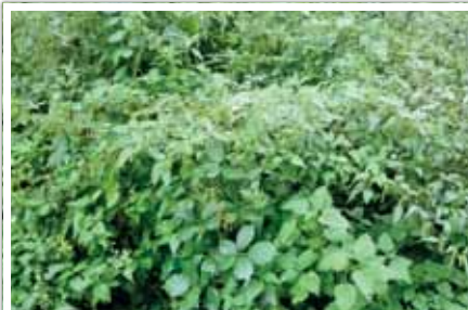
Verwilderter Brennnesselbestand: Wachsen Brennnesseln im eigenen Garten, sind sie auch zu pflegen. Die Nachbarparzelle darf von den Nesseln nicht beeinträchtigt werden, v. a. wenn sich regelmäßig kleine Kinder darin aufhalten.