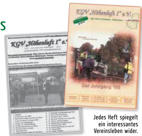
Jedes Heft spiegelt ein interessantes Vereinsleben wider.

Beide Formate halten, als elektronische Datei angelegt, das Vereinsleben teils ereignisbezo-