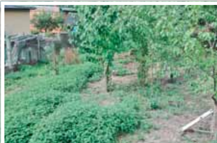
Brennnesseln vermehren sich über Wurzelasläufer und Samen und können so rasch größere Flächen bedecken. Was nicht für Jauche benötigt wird, kann kompostiert oder als Mulch zwischen Gemüsepflanzen verteilt werden.

Einige Brennnesseln ruhig stehen lassen. Brennnesseln bilden nahrhafte Samen aus, die gern von Vögeln gefressen werden. Zudem sind sie Wirtspflanzen für eine Vielzahl von Schmetterlingsraupen. Vor allem die klassischen Gartenschmetterlinge, unsere beliebten bunten Tagfalter (Admiral, Kleiner Fuchs, Tagpfauenauge, Distelfalter, C-Falter und Landkärtchen) sind auf Brennnesseln für die Kinderstube angewiesen. Wer Schmetterlinge an seinem Sommerfließer (Schmetterlingsfließer) beobachten will, muss auch Brennnesseln anpflanzen!