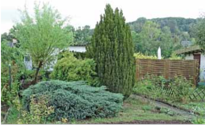
Mängel: Hier beeinträchtigen drei Nadelgehölze und eine Weide die kleingärtnerische Nutzung der Parzelle – alles im Kleingarten unzulässige Gehölze (im Vordergrund wahrscheinlich ein Wacholder, der die Pilzkrankheit Birnengitterrost überträgt). Sichtschutzwände wie im Foto rechts sind im Kleingarten nicht erlaubt (Alternative: Rankgerüste)