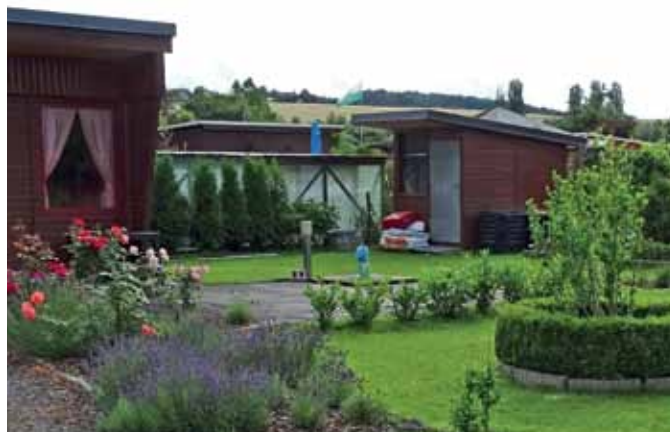
Mängel: In diesem Garten wurde ein Geräteschuppen als zweiter Baukörper im Garten zusätzlich zur Laube errichtet. Dies ist gesetzlich nicht zulässig. An der Gartengrenze wurden Nadelgehölze gepflanzt. Dies ist nach Rahmenkleingartenordnung nicht erlaubt (ungeeignetes Gehölz, da invasiv und bodenversauernd).