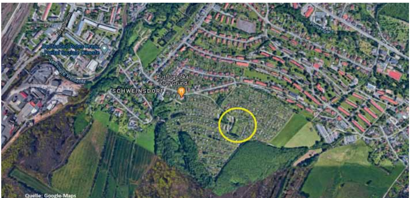
Festplatz inmitten der 340 Kleingärten

laden dazu alle Interessierten Gartenfreunde herzlich ein. Sofern es die Corona Schutzverordnung dann zu lässt, natürlich mit Kuchen, Bratwurst und einem frischgezapften Bier oder Limonade. Vor Ort wird die Fachberatung unseres Verbandes sein und eine Pflanzentauschbörse ist geplant. Wenn dann auch noch das Wetter mitspielt freuen wir uns auf ein kleines bisschen Normalität an diesem Nachmittag.