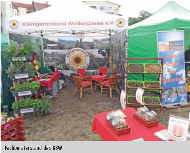
Fachberaterstand des KBW