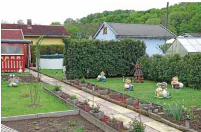
Mängel: Dieser Garten ist zwar gepflegt und ansprechend dekoriert, aber die Fläche für den Anbau von Obst und Gemüse beträgt weit unter einem Drittel der Pachtfläche. Der aufgestellte Pool ist dafür weit größer als 3 m 2 und hat mit einem Kinderplanschbecken nicht mehr viel zu tun.

Bei Baulichkeiten muss kontrolliert werden, dass diese den gesetzlichen Vorgaben entsprechen. Sie dürfen nur mit Zustimmung des Vereines/des Verbandes errichtet/verändert werden! Zu den Baulichkeiten zählen die Laube, Terrassen, Wege, Zäune, Sichtschutzrankgerüste an Terrassen, Gewächshäuser, Hochbeete, Frühbeetkästen, Kompoststellen, Teiche/Biotope, Grillkamine, Planschbecken und Spielmöglichkeiten