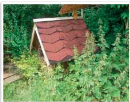
Eine kleine »wilde Ecke«, gesehen im KGV Flora I e. V.