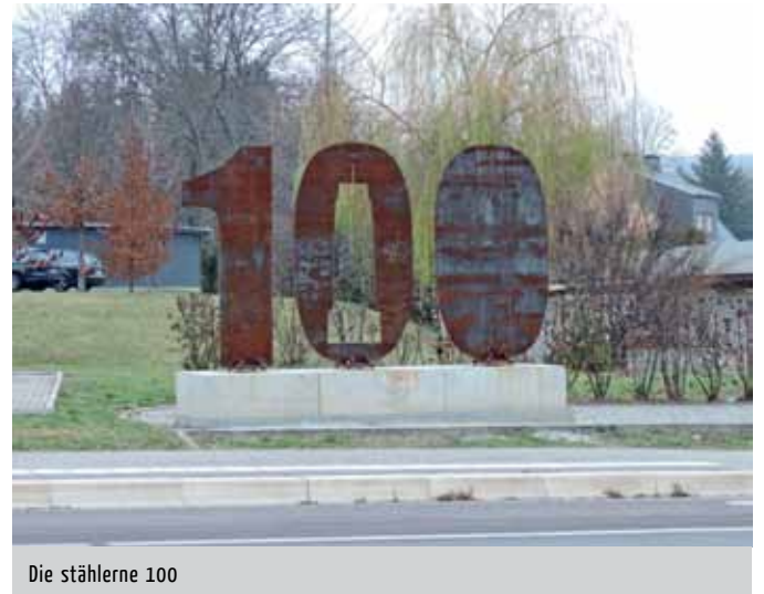
Die stählerne 100