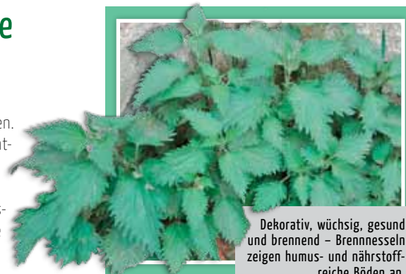
Dekorativ, wüchsig, gesund und brennend – Brennnesseln zeigen humus- und nährstoffreiche Böden an.