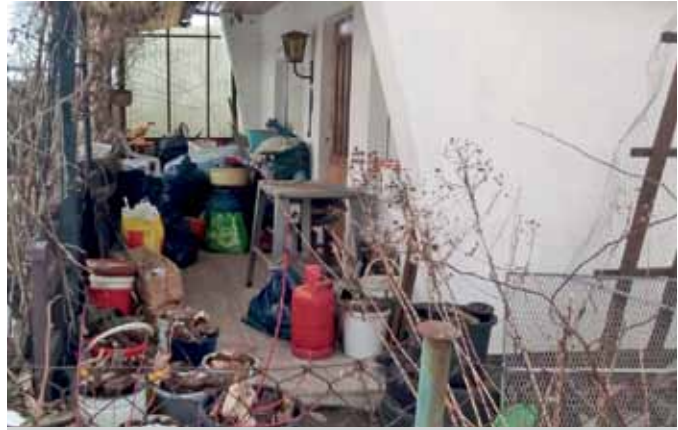
Mängel: Diese Pächter haben ihren Müll nicht zeitnah entsorgt, sondern vor ihrer Laube angesammelt: Müllsäcke, Eimer mit Bauschutt, Autoreifen – dies ist sicher kein schöner Anblick für die Gartennachbarn, zudem Rückzugsort für Mäuse und Ratten und eine Gefahr für Natur und Umwelt.

für Kinder. Es gilt die »Ordnung über die Zustimmung zur Errichtung, Änderung und Nutzungsänderung baulicher Anlagen in den Parzellen« des Territorialverbandes »Sächsische Schweiz« der Gartenfreunde e. V. vom 27.7.2020. Die Ordnung gibt es beim Vereinsvorstand oder kann über den Territorialverband abgefordert werden: geschaeftsstelle@tv-pirna.de. Weitere Informationen unter www.kleingaertner-pirna.de .