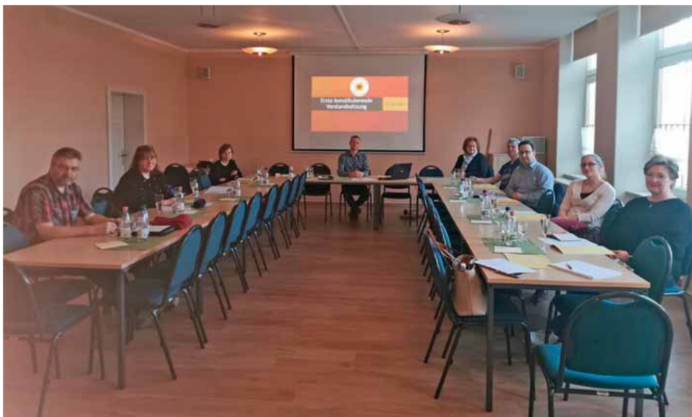
1. Konstituierende Vorstandssitzung am 11.03.2021